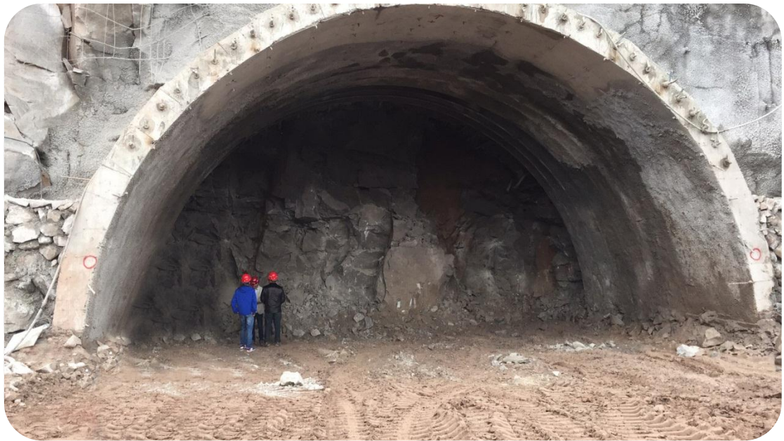
草坝隧道出口右洞套拱施工形象