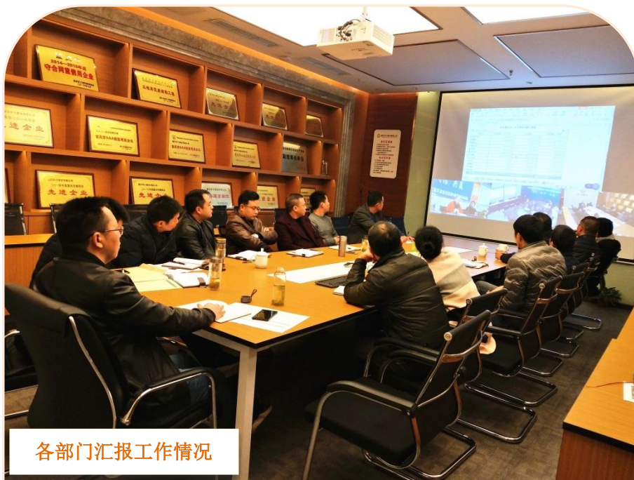
各部门汇报工作情况