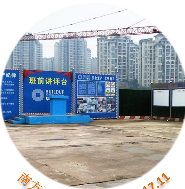
南方·碧水康桥工程 17.11