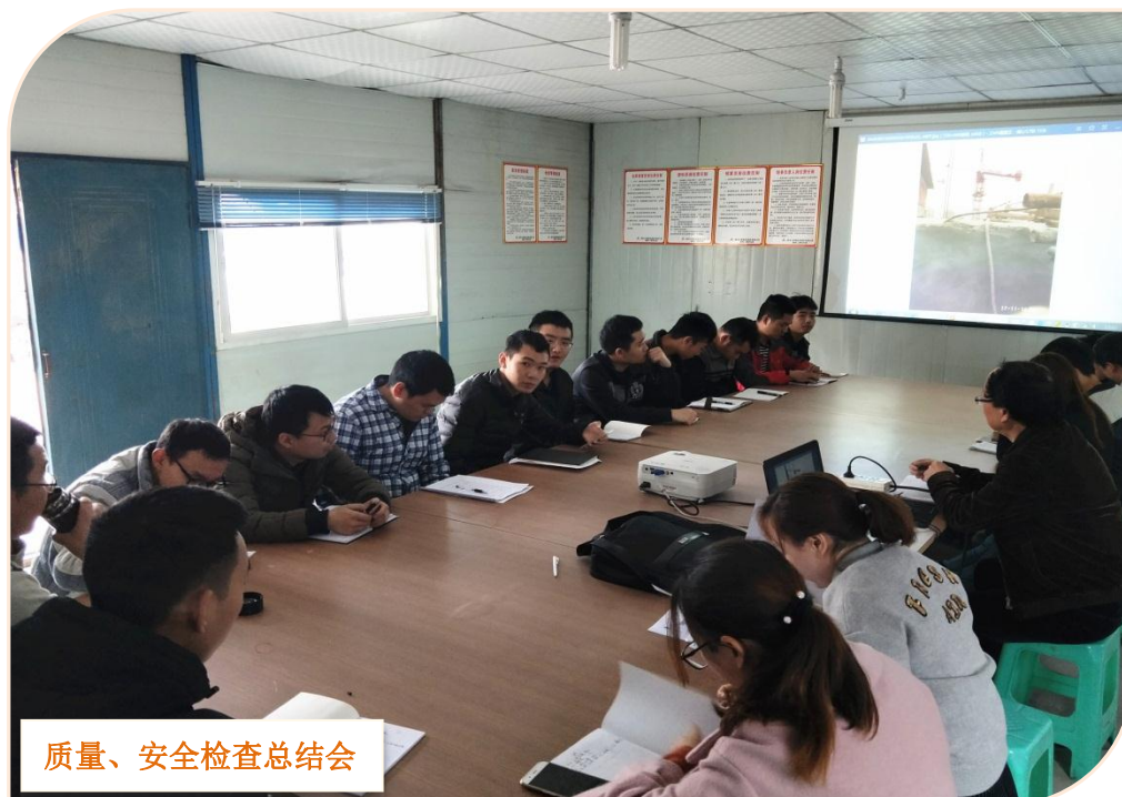
质量、安全检查总结会