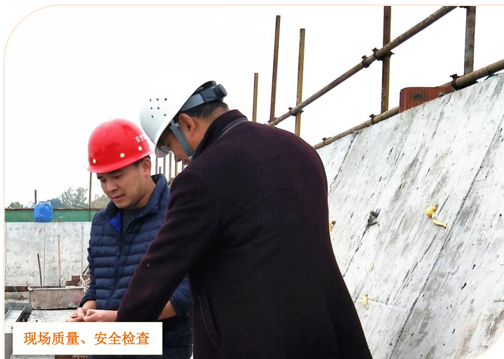
现场质量、安全检查