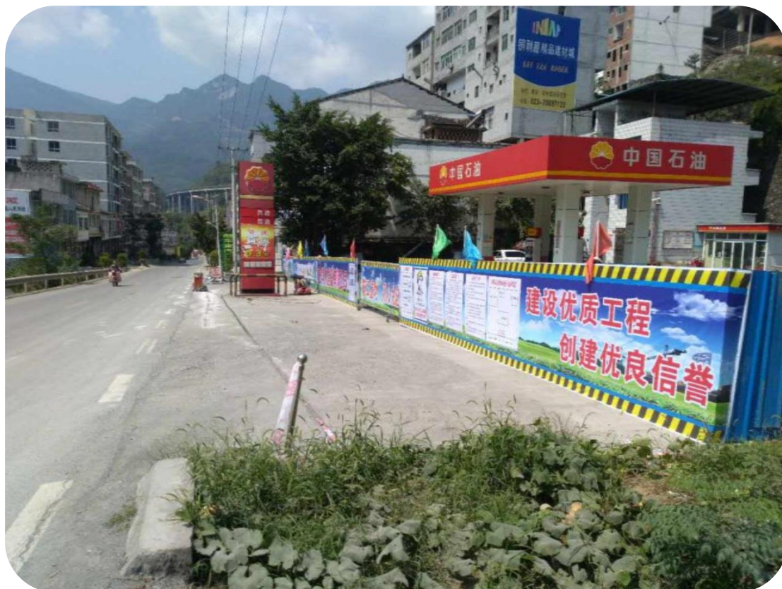
彭水高谷加油站改建工程