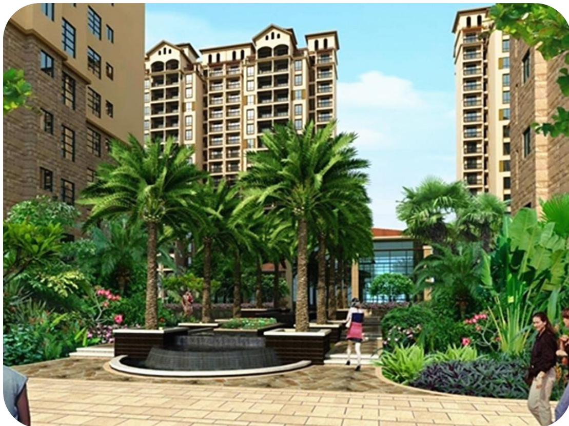
海南四季花园工程效果图