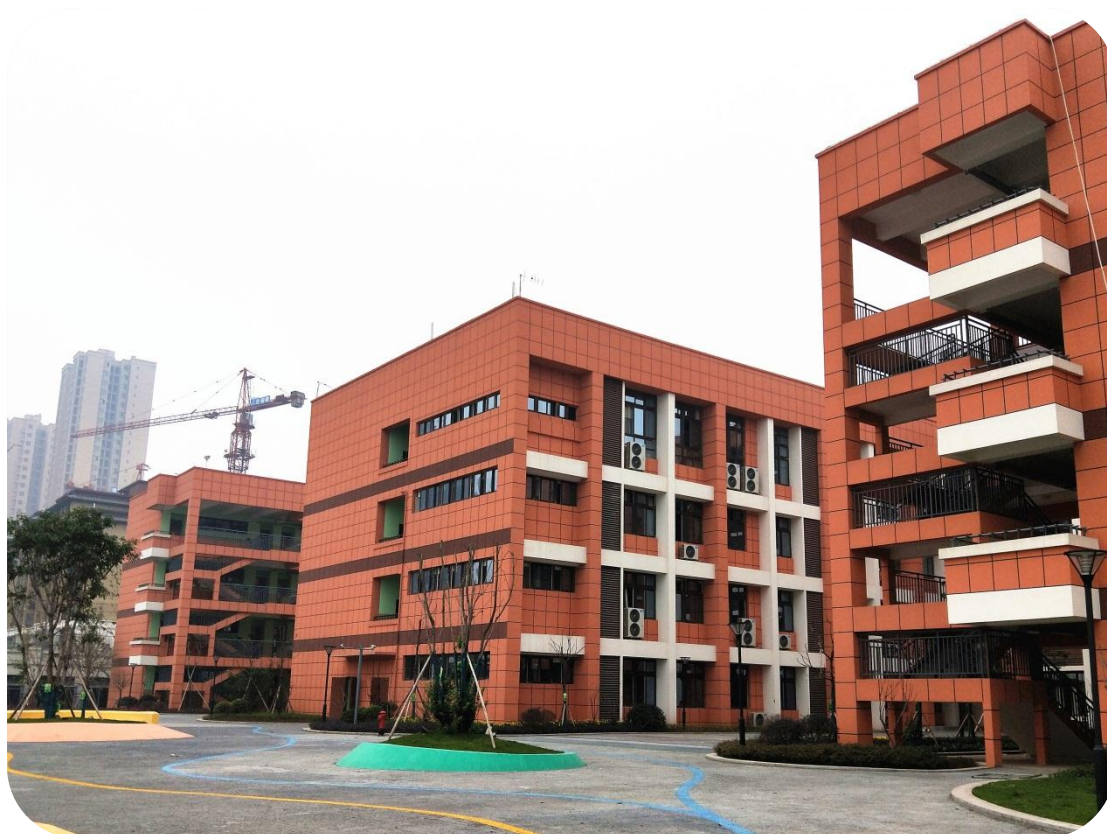
珠江城学校工程施工形象