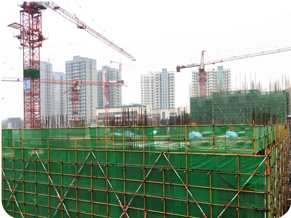
南方·碧水康桥工程