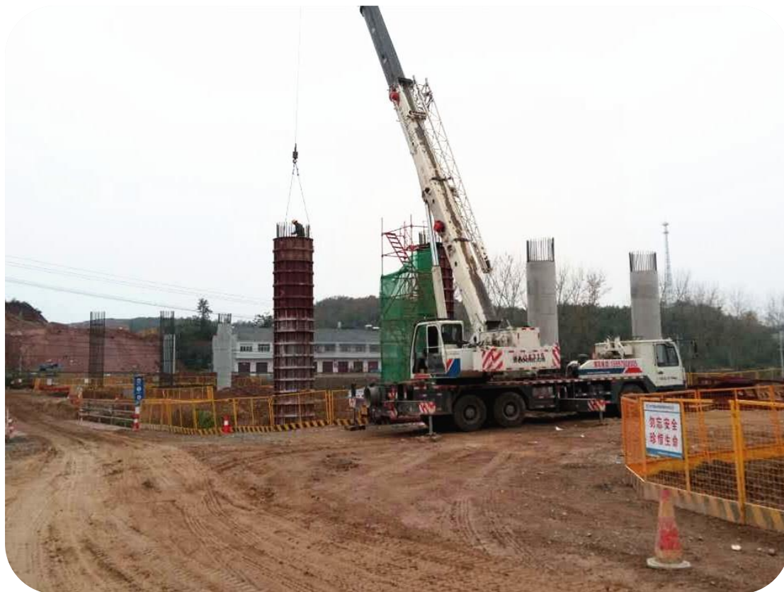
枣潜高速公路襄阳南段一标