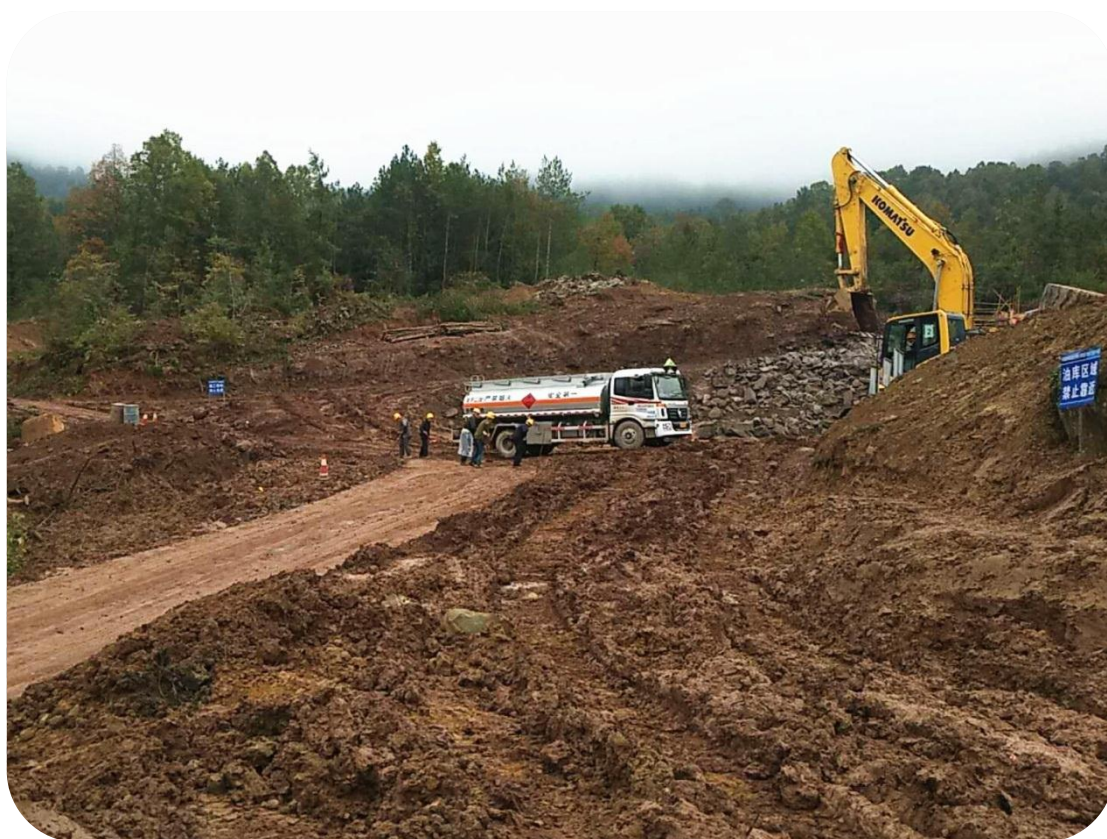
巴中至万源高速公路土石方工程施工形象