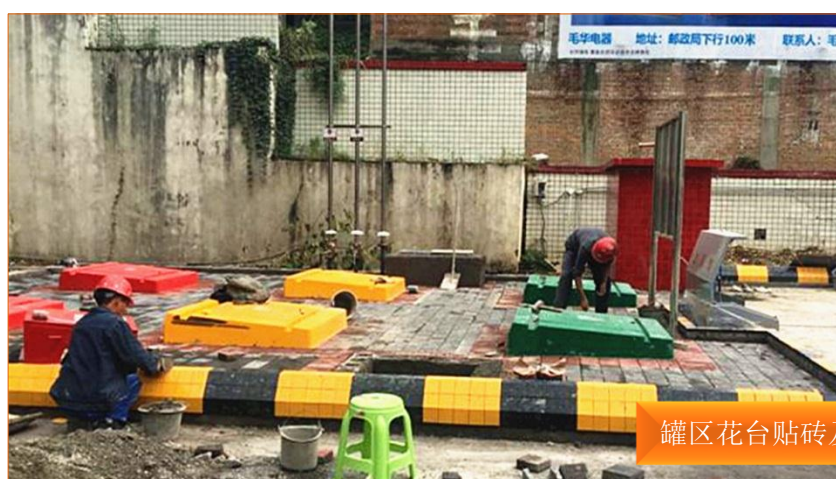
罐区花台贴砖及安装透水砖