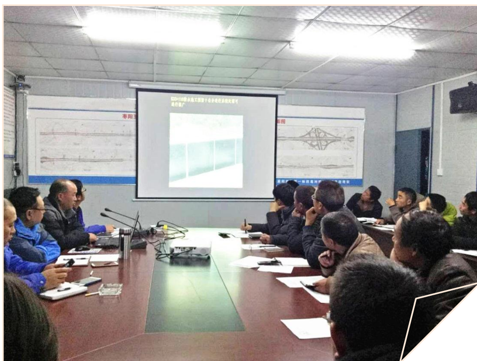
项目部安全生产会